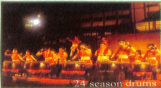
24 season drums